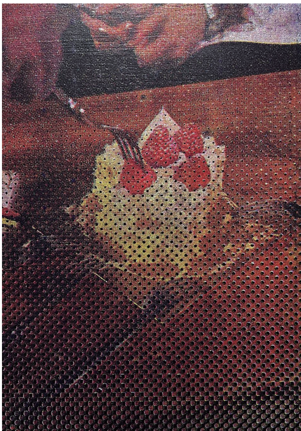
a cake 2023 シルクスクリーン、アルミ箔 297×210mm

私たちは確かにここに存在しているが、他者の介在によって不安定な存在になりうる。 他者の視線によって、自らが認知している姿とは別の姿が現れることもあれば、透けることもある。常に不確かな存在。