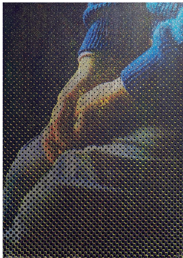
lukewarm hands 2023 シルクスクリーン、アルミ箔 297×210mm