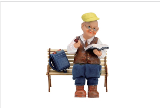
「結構長く使ってる物多い」 2018 おじいちゃんの人形、ミニチュアランドセル、ミニチュア黄色帽子、ミニ公園のいす、ミニチュア本

なにげない毎日。 ふと思ったことを書きためる。 大事なこと、どうでもいいこと、いろんなこと。 思ったことひとつひとつにはなにか意味がある気がする。 はっきり知りたいわけじゃないけどかたちにして残したくなった。