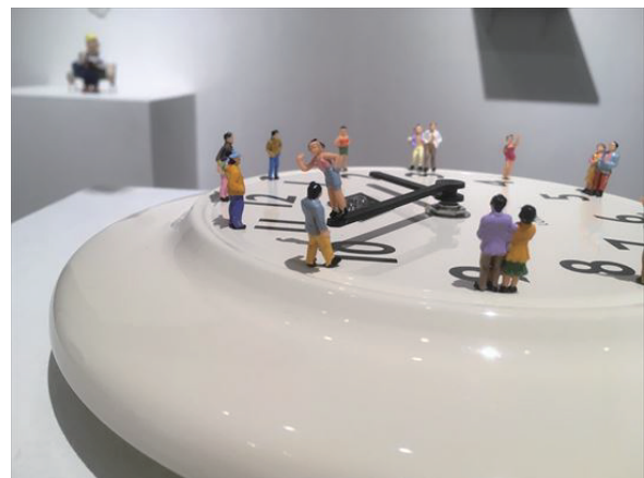
個展「ぬいぐるみ、と、あさ、グレープフルーツ、に、やわらかい、ひっこし」 展示風景 (2018)