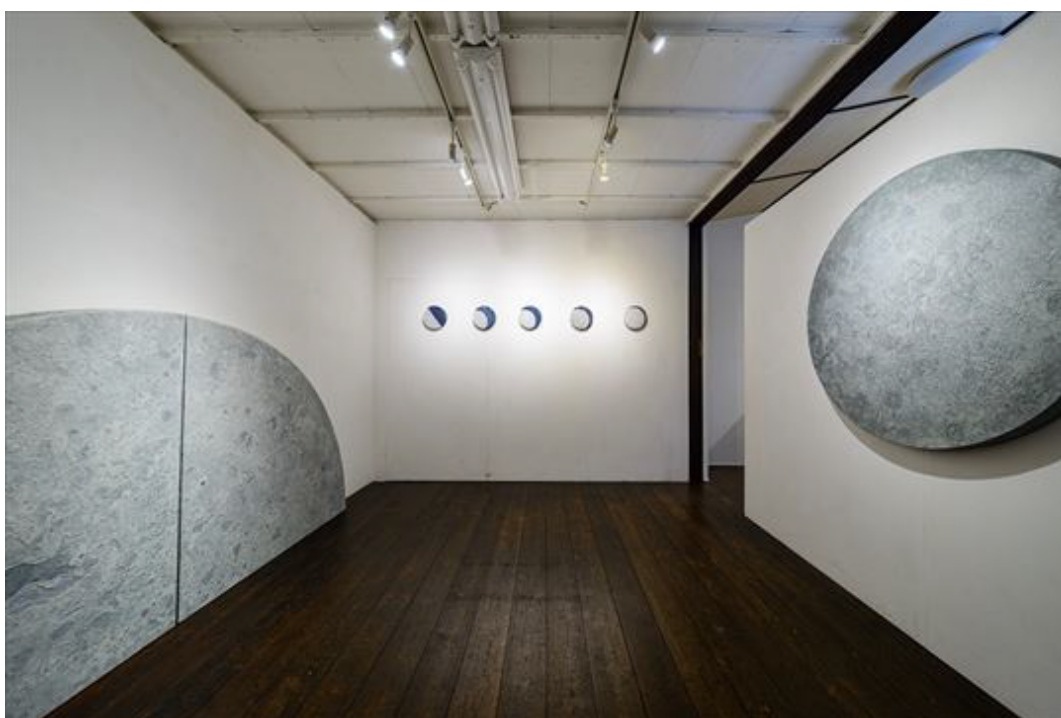
個展「表層の月」 展示風景（2019）より

私は、水と油の反発する作用を利用した画面の上に、絵の具を積み重ねていく行程を経て、作品を作る。 それらは、私が作品と向き合う回数や時間の蓄積により生まれた表層である。 形を留めることが困難な“視覚的現象”を、描画材料を用いて、視覚化することを意識して制作している。