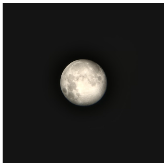
「私が見た月」 写真作品、サイズ可変