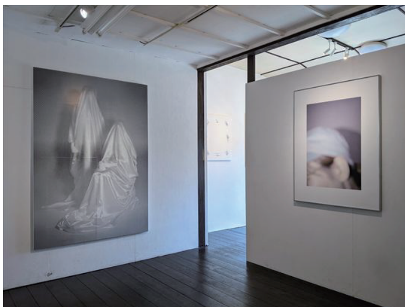
個展「私は父をみていた」(KUNST ARZT 2024) 展示風景

今回の展覧会では、俯瞰的に自身を見つめるという試みはそのままに、ほんの少し愛おしさを感じられるような展示になれば良いと思う。