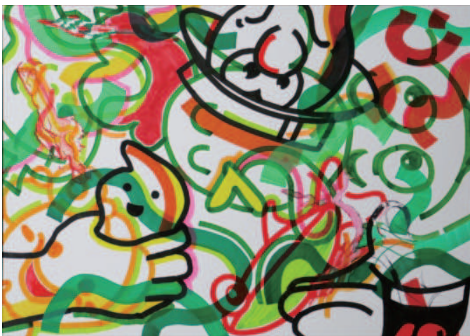
STORE BORD2 A3 横 イラストボードに水性ペン 油性ペン 2019

お店に並ぶ商品のパッケージ、特にキャラクターをモチーフにして制作しています。彼らそれぞれの魅力と、それが無数に集まって競合しあっているエネルギーが売場にはあると考えており、それをどんどん消費するように描いて、表現する試みです。