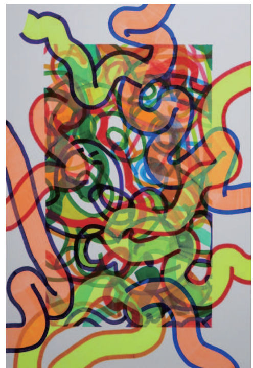
STORE BORD3 A3 縦 イラストボードに水性ペン油性ペン 2019