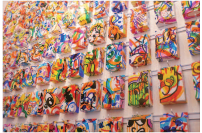
個展「ストアボックス」2018年展示風景