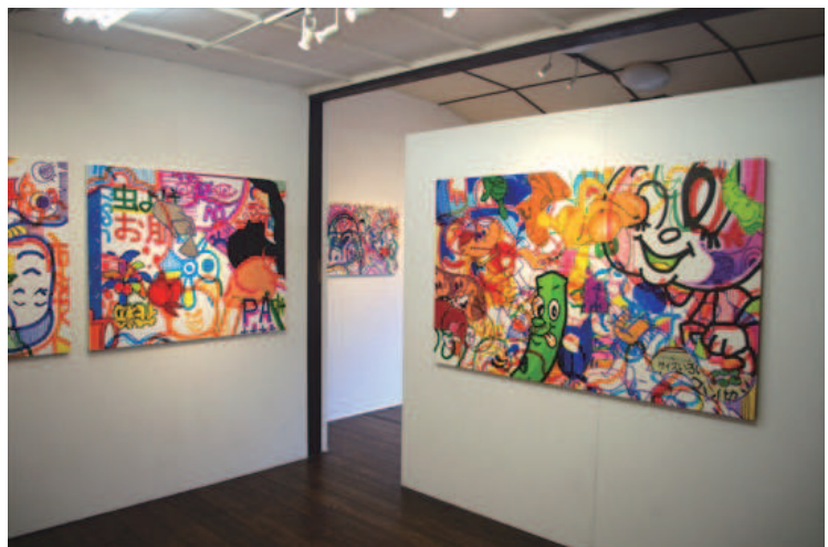
個展「ストアジャングル観光」2017 年展示風景