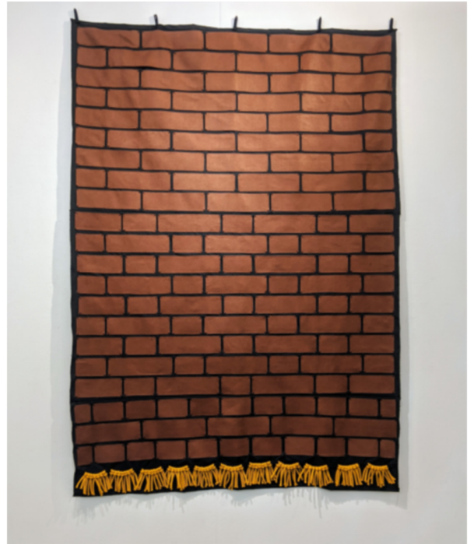
上2点 個展「I組み立て式」(2020) 展示風景より