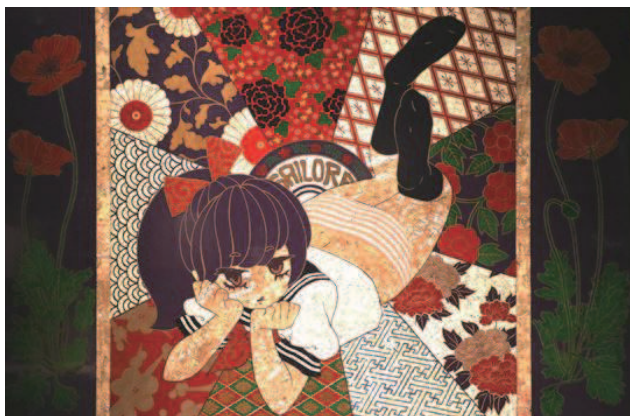
ハレのセーラーばんづ 2016 漆、金粉、銀粉、貝、卵殻、乾漆粉 / 木製パネル

漆という素材に惹かれ、触れてから、漆の魅力や可能性を人に広めたいと感じるようになりました。その時そのときで自分が興味を持ったテーマ、モチーフで制作しています。このところ、他人を思いやるということについて考えています。相手の気持ちを想像する、相手の立場に立って考えることはとても大事ですが、それでも他者と完全に理解し合うことは難しいです。それに直面した時にどういう行動をとればみんなが穏やかに暮らせるのか、それは理解できないものを理解しようとするのではなく、理解できないものを尊重することではないでしょうか。尊重するということはどういうことなのかをさがしています。