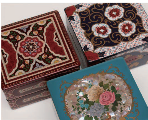
重箱 (異国ふう) 2015 漆、金粉、貝、卵殻 / 天然木