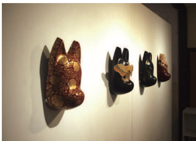
狐面 (インドふう) 2015 狐面 (ペイズリー) 2015 狐面 (クスサン) 2016 狐面 (金欄手ふう) 2016