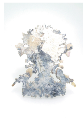
Baroque_Strawberry Thief 2021 白蝶貝、シルバー