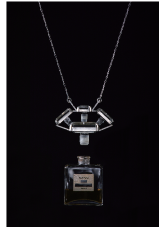
PARFUM_28ml 2019 香水瓶、シルバー