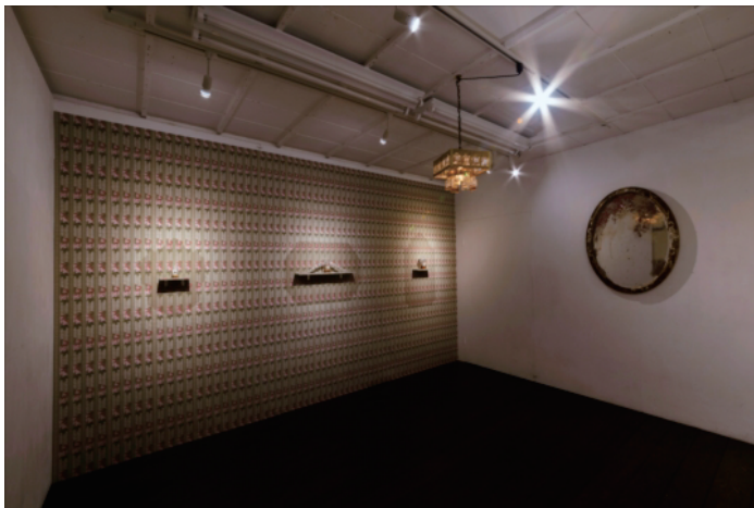
個展「PARFUM」展示風景(2019)

「闇と光が衝突した空間に鮮烈なドラマが生まれる」 この特徴をもつ「バロック」絵画の呼称は「バロックパール」(歪んだ真珠)が語源とされています。真円真珠養殖の歴史は1889年に日本で本格的に始まりました。その後1917年に安定的な量産に成功。1919年ロンドン市場で売りに出されるが天然真珠中心であった欧州では攻撃的になり1921年パリで裁判に発展しましたが、1924年の判決で本質的に天然真珠と変わらないと認められ今日に至ります。近年、趣向品目的での生き物の飼育、狩猟は問題視されています。しかし、真珠の養殖については趣向品目的であるにもかかわらず問題視されていない。そして真珠を取り出した後の真珠母貝は多くの場合コストをかけて大量廃棄されます。大量消費社会の光と影。社会の歪みというコンセプトを核として、“ジュエリー”になるために育てられた真珠母貝を美しいバロックパールのジュエリーにつくり変えます。