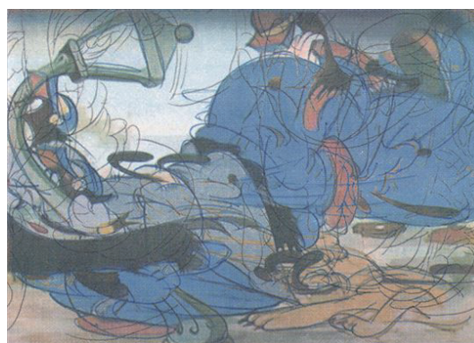
Pushed out 2023 silkscreen, paper 364×257mm