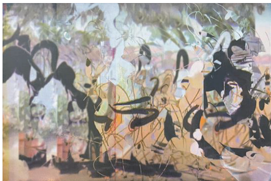
Dog and Cat flying around 2023 silkscreen, canvas 606×910mm