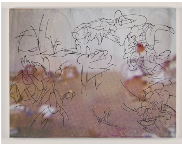
priprism Panic in the room 2 2023 silkscreen, canvas 410×530mm

映像の中には、動いてる物の原型を留めるよりも、いかに「動き」を大きく表現しているのかがアニメーションには隠れている。リズムカルでスピーディーなコマの中にどれだけ見落としてしまっている形や曲線があるのかを探り、抽出(トレース)していく。抽出された実態を持たない存在とは、どのように画面上に現れてくるのかを試みる。