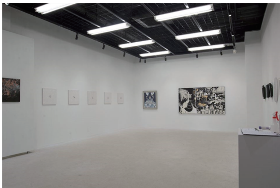
個展「還らない国」(2022) (成安造形大学/滋賀)での展示風景