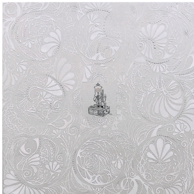
そこに鼓動があったこと 2023 ペン/胡粉/和紙 45.0 × 45.0cm