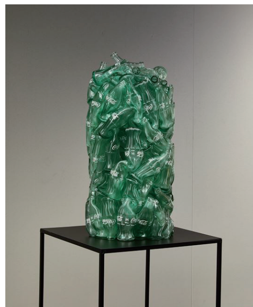
Accumulation of memory 2019